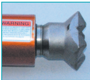
Шток слегка выдвинут