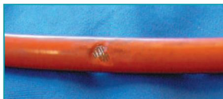
поврежденные шланги не использовать