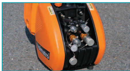
установка пылезащитных колпачков