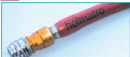
проверить ограничители перегиба шлангов

Поврежденные шланги подлежат немедленной замене.