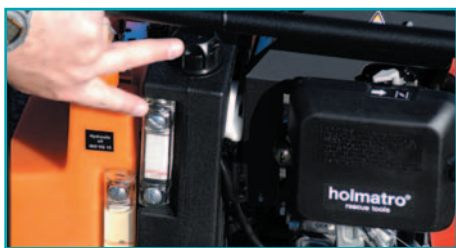
проверка уровня топлива