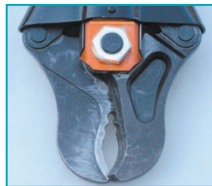
Лезвия немного перекрываются