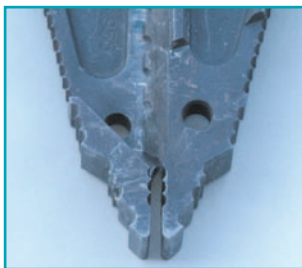
Наконечники слегка раскрыты