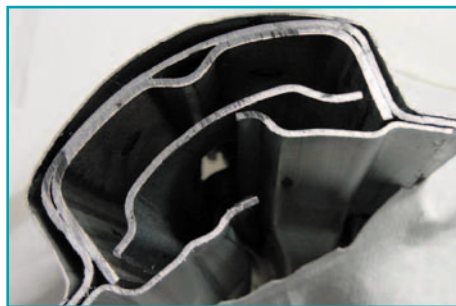
поперечное сечение средней стойки В, мод. 2002

Необходимо особо отметить, что те методы, которые описываются в данной публикации, разрабатывались с учетом новейших технологий, которые используются в автомобилестроении. Далеко не все инструменты обладают одинаковыми возможностями, поэтому необходимо, чтобы Вы выбирали технологию, оптимально соответствующую возможностям Ваших аварийно-спасательных инструментов. Не забывая о том, что эвакуация пострадавших из транспортных средств связана с определенной опасностью, следует помнить также и о том, что все выполняемые операции и действия являются разумным компромиссом между безопасностью и эффективностью работы. С опытом процесс определения опасных ситуаций или состояний в значительной степени упрощается.