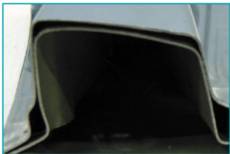
поперечное сечение средней стойки В, мод. 1996

Бурное развитие транспортных средств, а также безопасности и надежности их конструкции означает, что как методы эвакуации пострадавших в ДТП, так и соответствующее арийно-спасательное оборудование должны быстро изменяться в соответствии с прогрессом автомобильной промышленности. В некоторых случаях в книге приводятся и возможные альтернативные методы. Это связано с тем, что каждый случай эвакуации пострадавших является в своем роде уникальным, а в некоторых ситуациях приведенные методы не являются достаточно эффективными. Некоторые усовершенствования конструкции современных транспортных средств впечатляют нас больше чем другие, но необходимо выделить общие отличия, связанные с производством современных автомобилей.