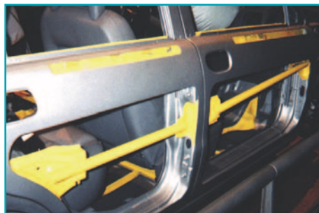
При фронтальном столкновении демонтаж дверцы затрудняют боковые усилители дверей.