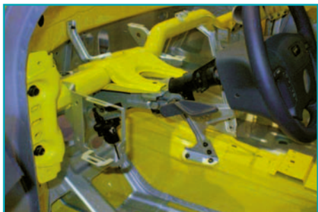
Борированные усилители передней панели могут помешать технике ее подъема

Необходимо особо отметить, что те методы, которые описываются в данной публикации, разрабатывались с учетом новейших технологий, которые используются в автомобилестроении. Далеко не все инструменты обладают одинаковыми возможностями, поэтому необходимо, чтобы Вы выбирали технологию, оптимально соответствующую возможностям Ваших аварийно-спасательных инструментов. Не забывая о том, что эвакуация пострадавших из транспортных средств связана с определенной опасностью, следует помнить также и о том, что все выполняемые операции и действия являются разумным компромиссом между безопасностью и эффективностью работы. С опытом процесс определения опасных ситуаций или состояний в значительной степени упрощается.