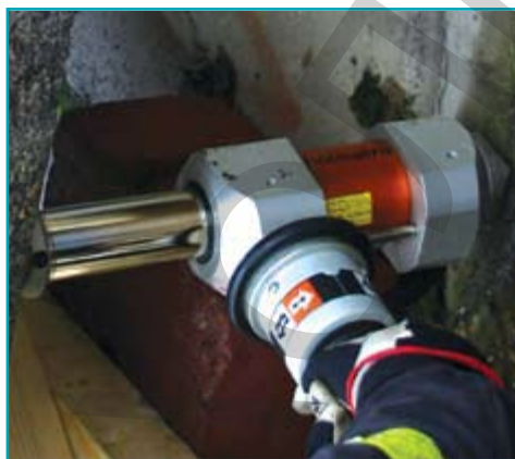
Телескопический мини-гидроцилиндр создаёт проём

В принципе, гидроцилиндр не считается инструментом для подъёма. Его использования для этих целей следует избегать, поскольку любое смещение груза может повредить гидроцилиндру изгибом штока. Также необходимо помнить, что гидроцилиндры не имеют механических фиксаторов, поэтому всегда следует тщательно следить за гидравлическим давлением в системе.