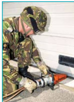
Гидроклин открывает подъёмную дверь

Гидроклин работает посредством выдвигания клина из инструмента между двух узких твёрдых пластин, что создаёт подъёмную силу свыше 20 тонн.