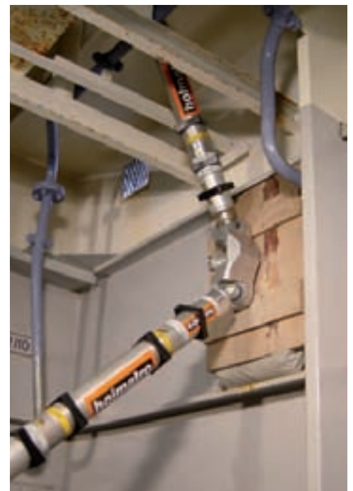
3-сторонние поворотные опоры используются для установки стоек в различных направлениях.