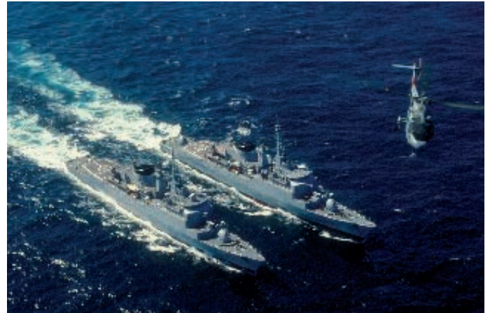
Система PowerShore™ может использоваться для ликвидации течей на кораблях.

Универсальность системы Holmatro PowerShore™ не исчерпывается указанными способами применения в спасательных операциях. Так же система может использоваться для ликвидации течей на кораблях. Для различных специфических аварийных ситуаций в море, Holmatro специально адаптировала компоненты системы PowerShore™, что привело к созданию новых решений для различных морских ситуаций, например, для ликвидации течей в переборках (корпусе).