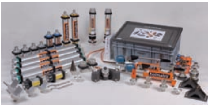
Комплект для ликвидации течей