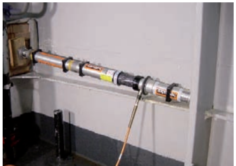
Гидравлические распорки в комбинации с удлинителями, опорами и брусом, использованы для ликвидации течи на корабле.